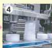
④開封した袋に、材料を充填(投入)。