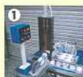
①ガセット袋を1枚づつ引き出して、開封・成型。