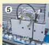
⑤折込み装置とシール・印字装置